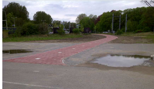
Olifantenpad. Foto's Arnold Los (mei 2012)

Ook door diezelfde inzet van de werkgroep Verkeer Wijkplatform, werd een vangrail aangelegd, na een verzoek van een jaar daarvoor, bij de spoorwegovergang op de Velsertaverse. De situatie was gevaarlijk voor voetgangers en fietsers die in de bocht stonden te wachten voor het rode verkeerslicht. Het secretariaat van het WPF heeft vijf verzoeken geschreven aan de Provincie, de projectleider, de Gemeente Velsen, de Gemeente Beverwijk en Rijkswaterstaat. Uiteindelijk heeft de Provincie de klus geklaard.