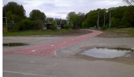
Olifantenpad. (mei 2012)

Ook door diezelfde inzet van de werkgroep Verkeer Wijkplatform, werd een vangrail aangelegd, na een verzoek van een jaar daarvoor, bij de spoorwegovergang op de Velsertaverse. De situatie was gevaarlijk voor voetgangers en fietsers die in de bocht stonden te wachten voor het rode verkeerslicht. Het secretariaat van het WPF heeft vijf verzoeken geschreven aan de Provincie, de projectleider, de Gemeente Velsen, de Gemeente Beverwijk en Rijkswaterstaat. Uiteindelijk heeft de Provincie de klus geklaard.